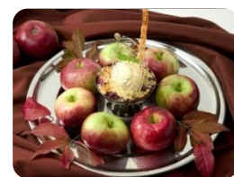
Deser lodowy z jabłkami

Deser: „Czekoladowy Przedsmak Raju” - czekoladowe ciastko z malinowym sosem,