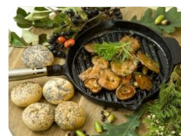
Rydzę z patelni

Deser: carpaccio z ananasa z cytrynowym sorbetem skropione rumem Malibu pieczywo, masło smakowe